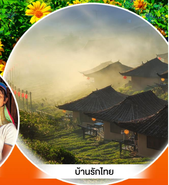
บ้านรักไทย