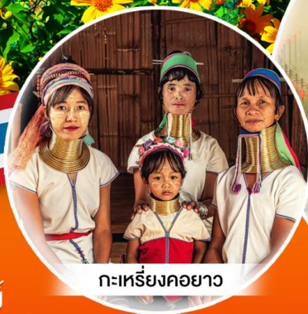
กะเหรี่ยงคอยาว